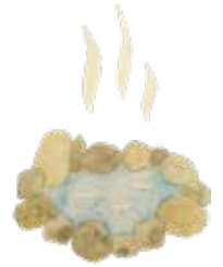
4. 足湯 ▶ p. 12