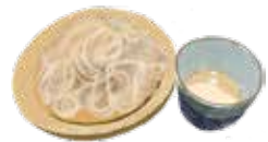
3. 萱／そば ▶ p. 20