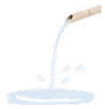
1. 飲泉所 ▶ p. 12

千曲市内の移動には車、バス・電車などの公共交通機関が便利。美しい自然や古い時代の面影を残す街並みを楽しむためには、あまり目的地を急がず、ふらっと散歩してみるのもオススメだ。