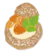
2. 上山田 ラ・パン・エレガント ▶ p. 23